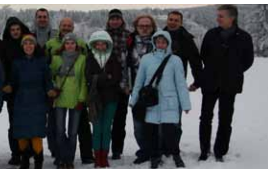
Masarykova chata na Masarykově chatě