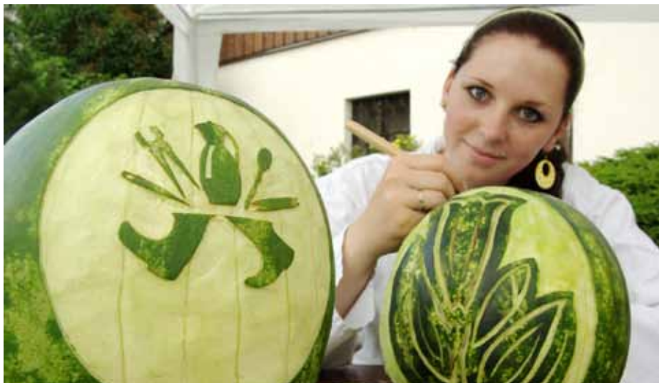
Loga projektu Via fabrilis a Správy KRNAP, vznikly na slavnostním otevření nových expozic ve vrchlabském muzeu.

Stukilometrowy szlak wiedzie z Vrchlabí do Bolesławca i obejmuje jedenaście stacji. Każda stacja charakteryzuje tradycyjną działalność rzemieślniczą danego miejsca. Na czeskiej stronie zaprosiłabym na przykład do Karkonoskiego Muzeum w Jilemnicach, gdzie zwiedzający mogą zobaczyć ekspozycje związaną z narciarstwem, czy