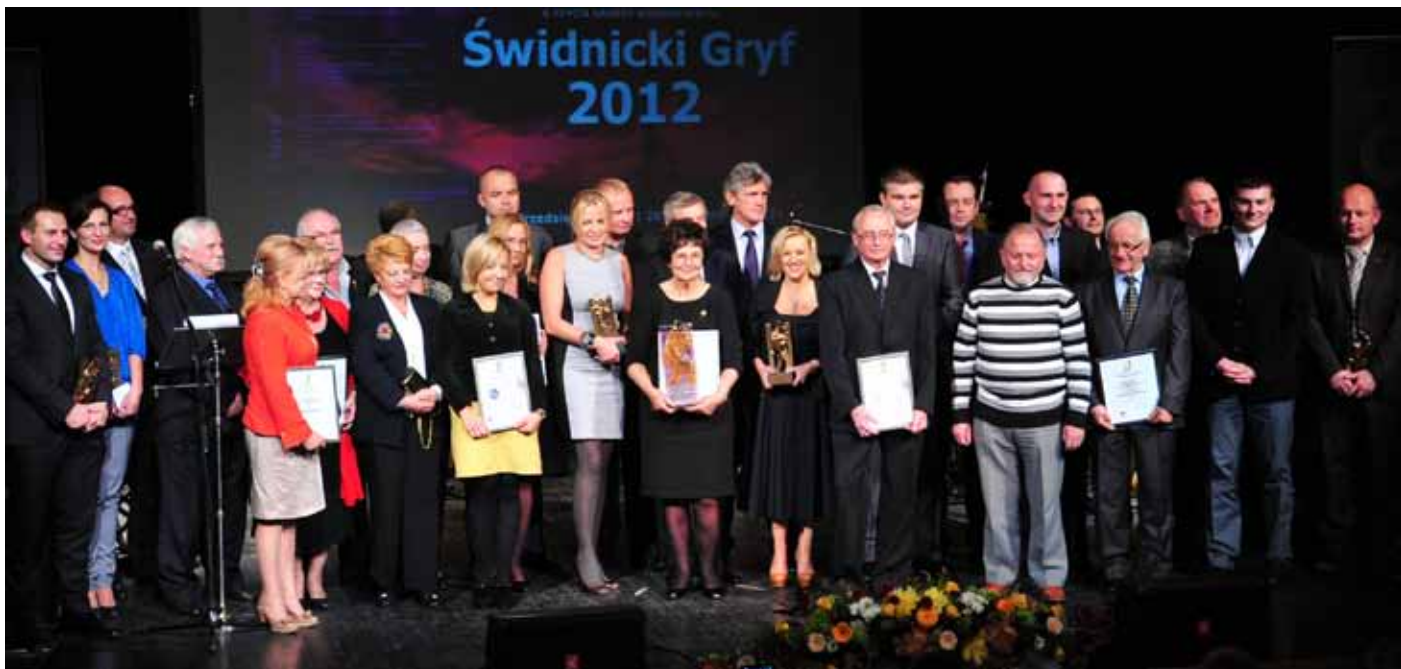
Laureaci Świdnickiego Gryfa 2012 w komplecie / Vítězové Šwidnického Gryfu 2012 pohromadě