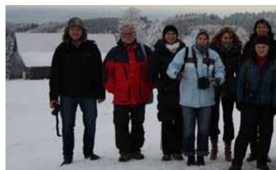
Účastníci mediálních dnů u polsko – české hranice u Masarykovy chaty. Účestníci Dni Mediów na czesko-polskiej granicy pod schroniskiem

Tentokrát několikačlenná skupina novinářů a fotoreporterů z médií walbrzyského regionu vyrazila do Orlických hor, kde se školili v oblasti fotografie. Během před-