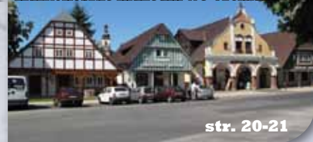
Krkonošské muzeum ve Vrchlabí Karkonoskie muzeum we Vrchlabi