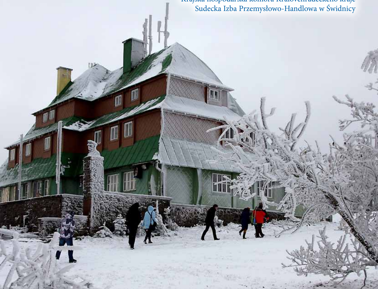
Krkonošský veletrh v Trutnově Wystawa Karkonoska w Trutnowie

Krajská hospodářská komora Královéhradeckého kraje Sudecka Izba Przemysłowo-Handlowa w Świdnicy