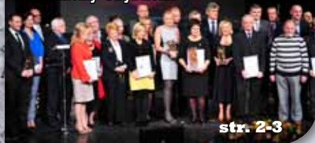
Świdnicki Gryf 2012 Swidnický Gryf 2012