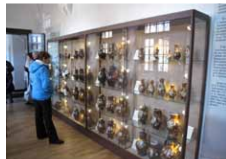
V partnerském Muzeu Ceramiki v Boleslavci byla vytvořena nová stálá expozice dokumentující tamnější výrobu kameniny.

Via fabrilis nagrodzono w Polsce jako jeden z najlepszych wspólnych projektów ukierunkowanych na turystykę. Z chęcią byśmy kontynuowali ten projekt jako Via fabrilis II. Skupimy się na większej promocji „szlaku tradycji rzemieślniczych” i zaangażowaniu poszczególnych odwiedzających, którzy poznają tradycje rzemieślnicze.