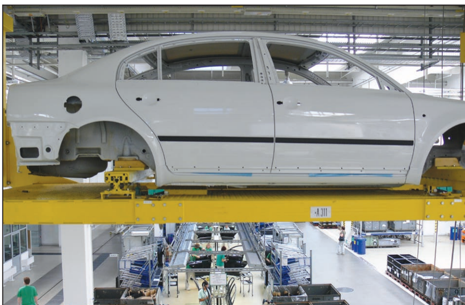
Poláci využívají především nabídku volných pracovních míst jako agenturní pracovníci automobilky Škoda. Foto: Miloslav Dostálek / Polacy wykorzystują przede wszystkim oferty wolnych miejsc pracy jako pracownicy agencyjni zakładów samochodowych Škoda. Zdjęcie: Miloslav Dostálek

„Tato spolupráce je bohužel spíše jednostranná, neboť obráceně čeští nezaměstnaní o práci v Polsku zájem nemají a navíc tamní nezaměstnanost je vyšší než v ČR. Je