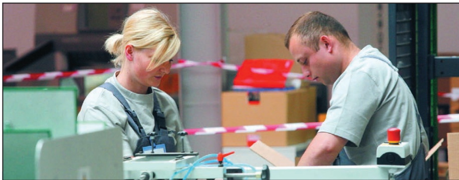
Firma Gryphon sp. z o.o. wdraża innowacyjną technologię wytwarzania folii stretch w rolkach ręcznych i maszynowych oraz folii PP w jednym cyklu produkcyjnym. / Firma Gryphon sp. z o.o. zavádí inovační technologii výroby ručních a strojních stretch fólií a PP fólií v jednom výrobním cyklu.

Inovací je také rozvoj lékařských zařízení